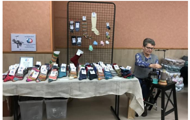
Les Points d'H.O. – Chaussettes artisanales réalisées avec une machine circulaire à tricoter de 1908, importée du Canada.