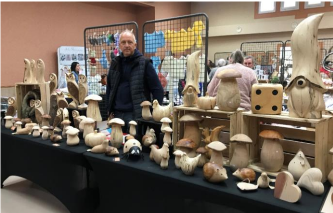
Art & Bois by Cédric Confection d'objets en bois sur la base de supports monoblocs