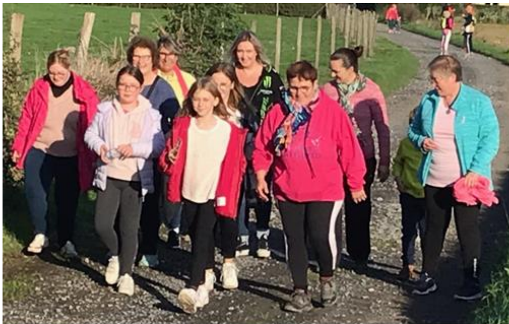
Au détour du parcours