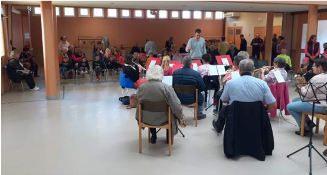
Un public à l'écoute de la prestation musicale proposée