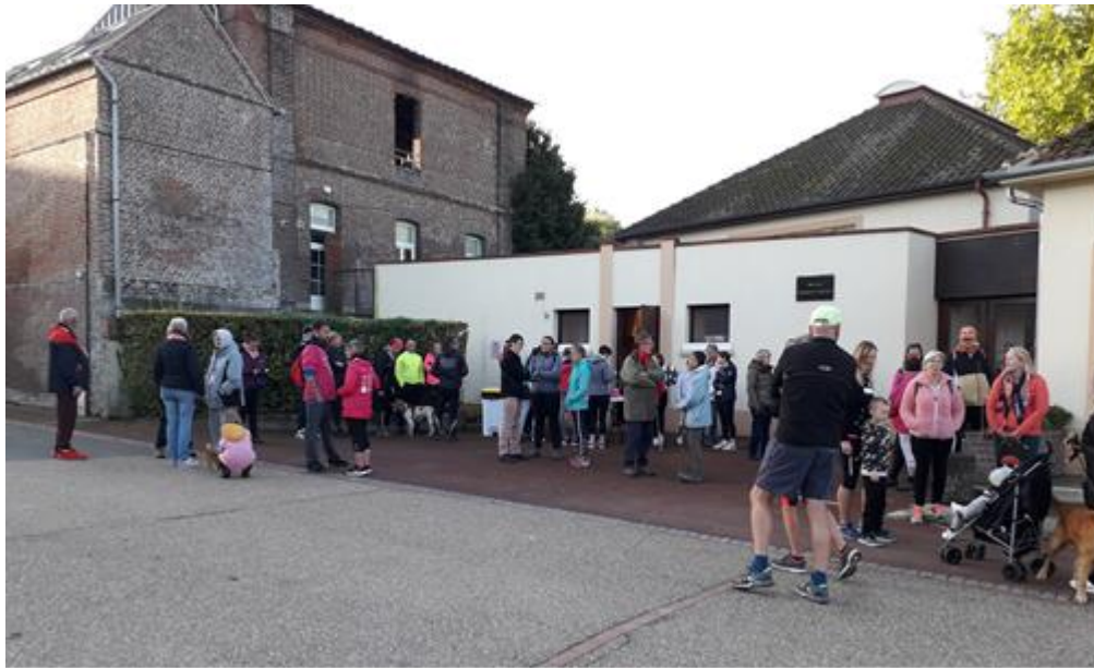
Des participants en attente du go de départ ....

Après la marche, un Apéro' Rose était proposé par l'harmonie municipale.