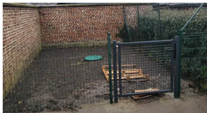
Remplacement du grillage et de la barrière zone de la citerne à gaz - parking du restaurant.