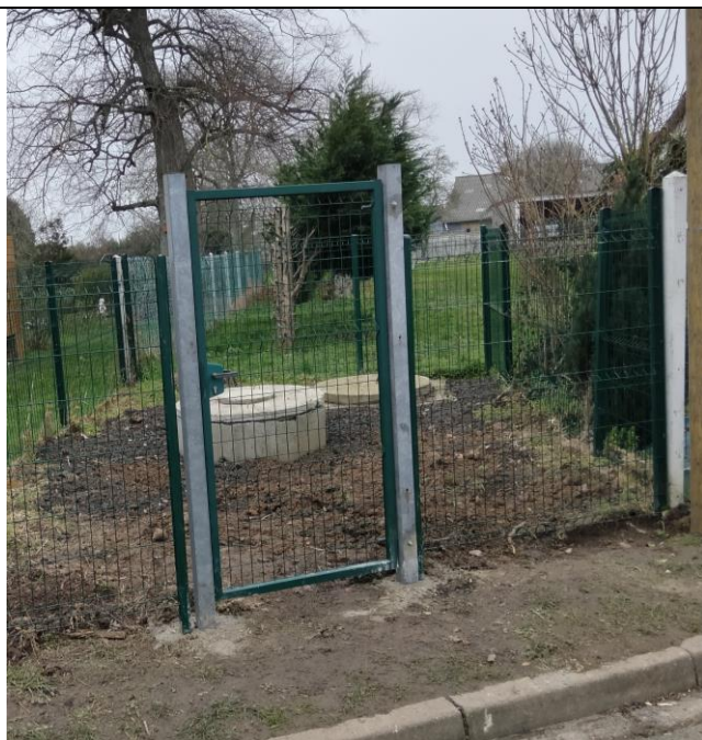
Pose d'une barrière sécurisant l'accès au puits communal - rue Barre Duquesne.

D'autres aménagements ont été réalisés tels :