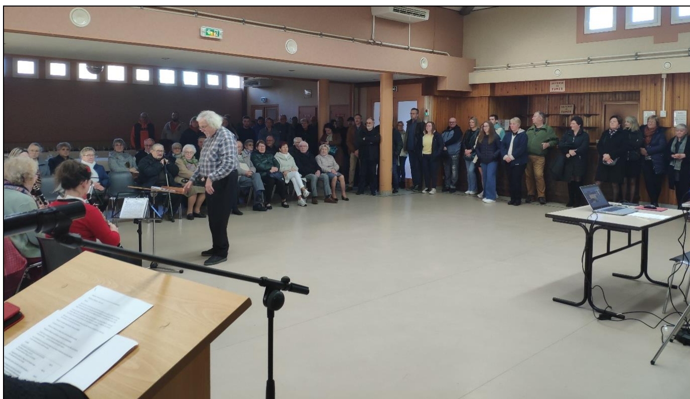
Une partie de l'assistance